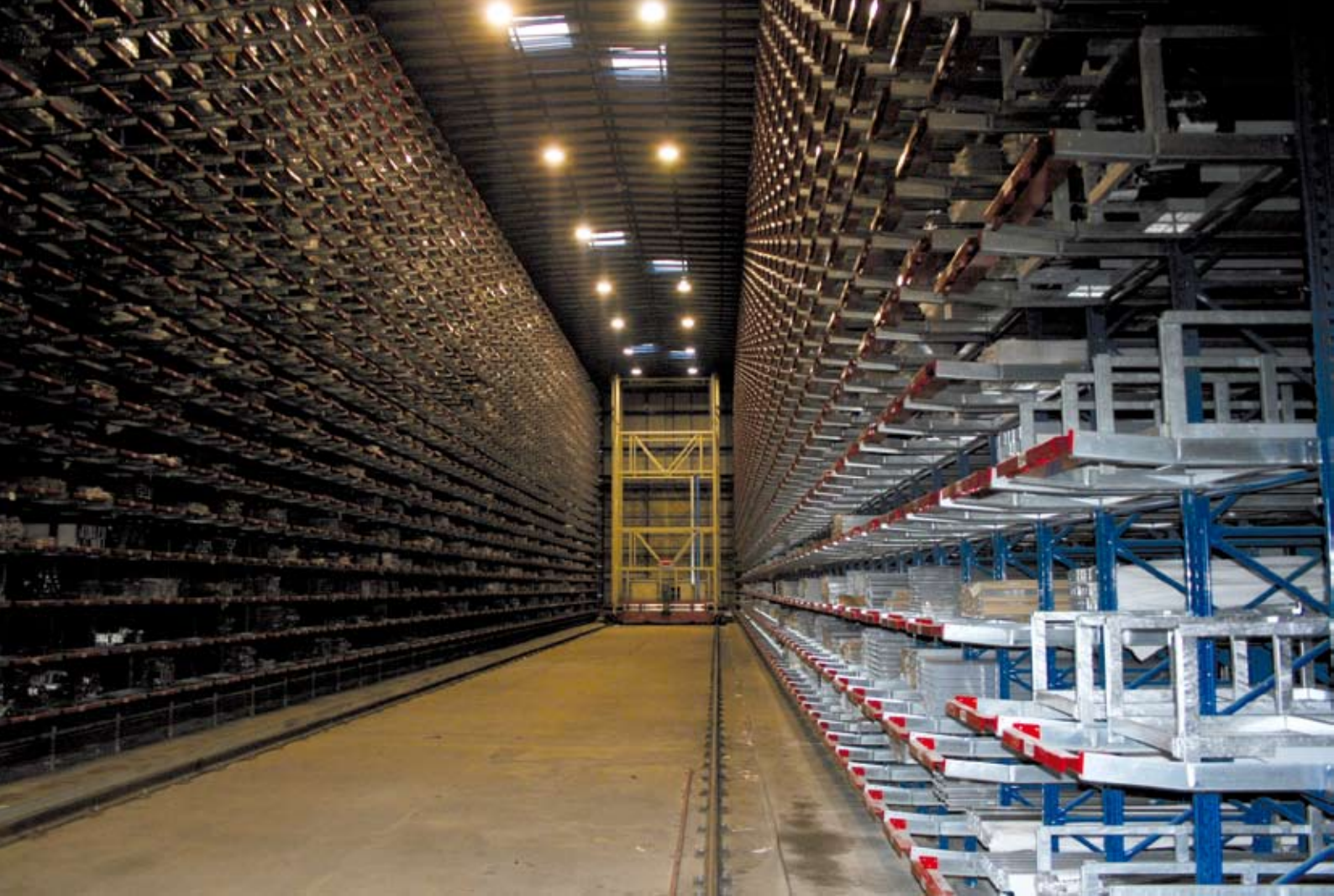
9 - Il magazzino a logistica computerizzata.

9 - The warehouse with computerised logistics.