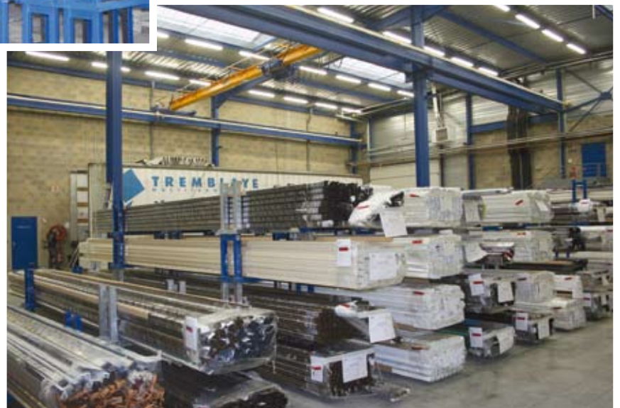
6 - L'area prodotto finito. 6 - The finished product area.