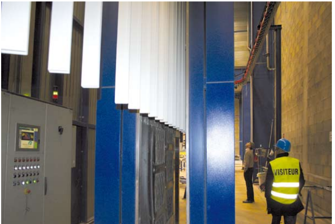
19 - Un'altra immagine dell'uscita dei pezzi dall'impianto di verniciatura.