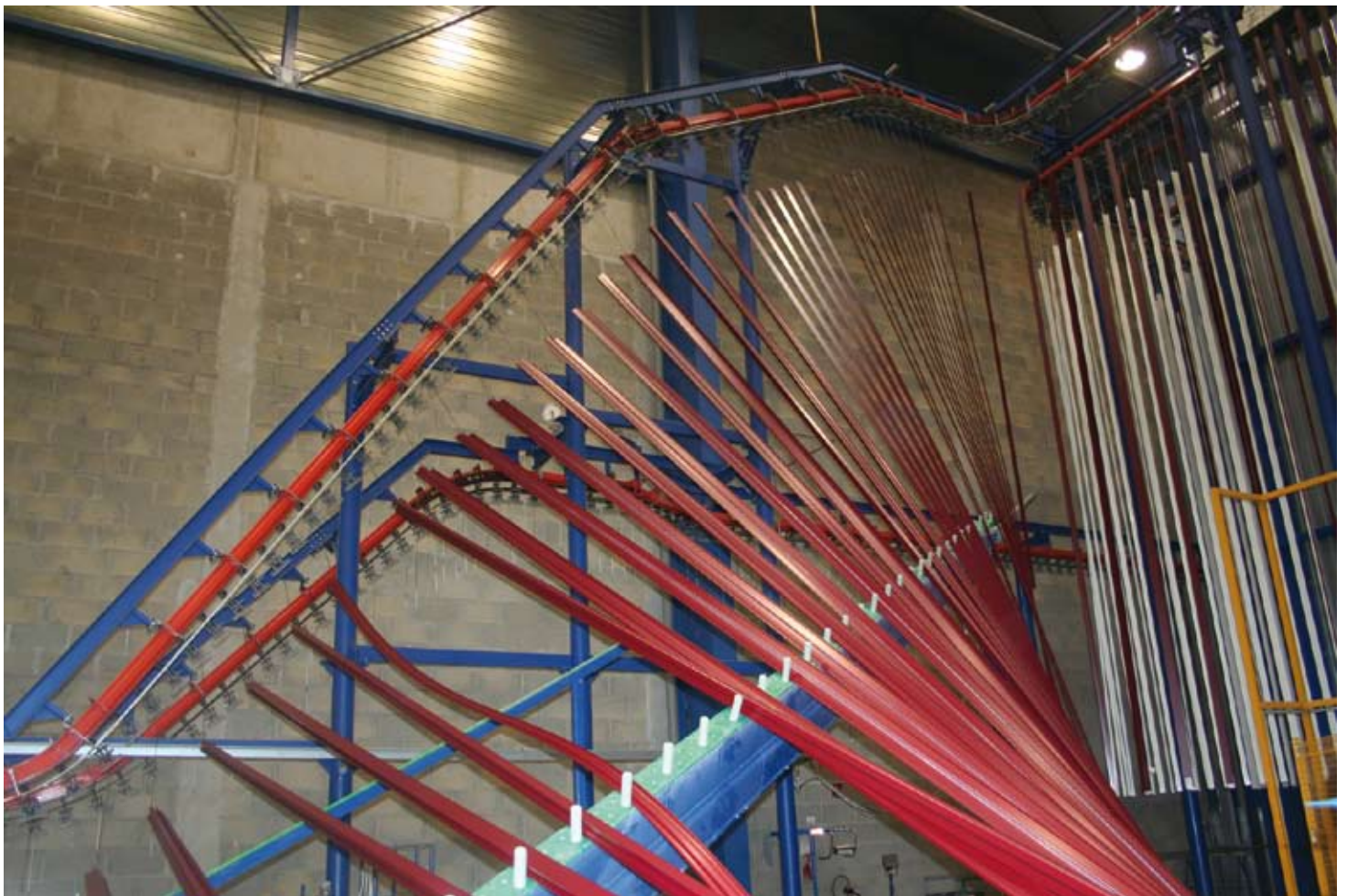
19 - Another picture of the pieces coming out of the coating plant.