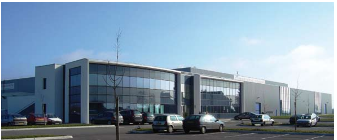
1- Sepacolor in Genlis (South of France).