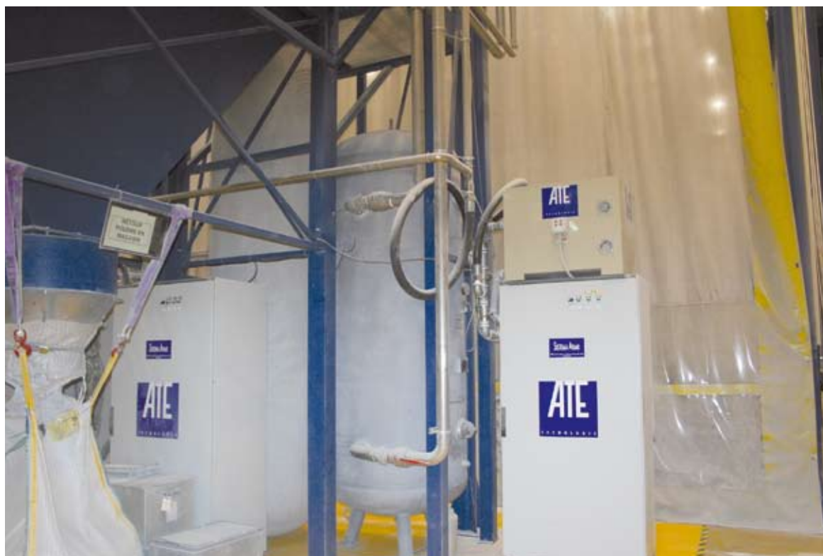
17 - L'ingresso e l'uscita del forno di fusione a infrarossi.

16 - The installation area of the Atimix system.