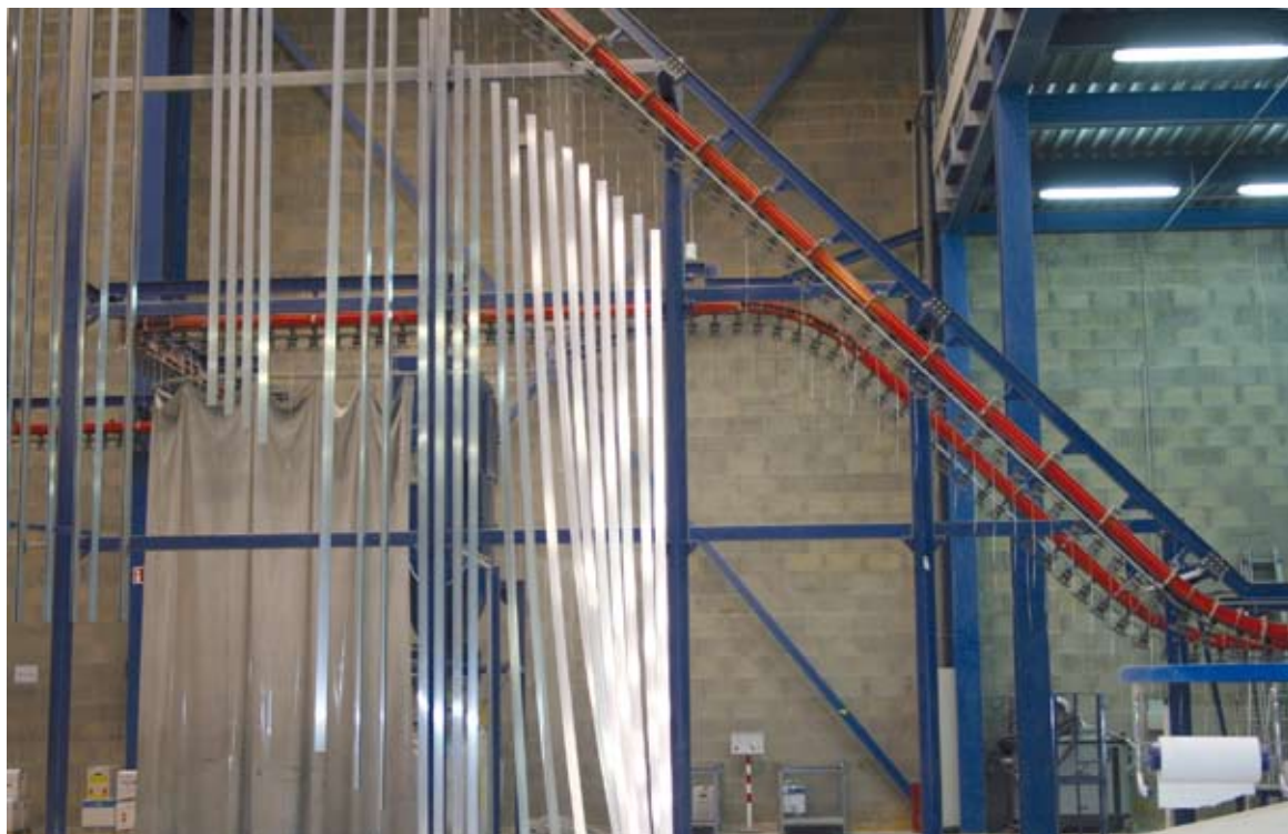
13 - Il carico dei profili sull'impianto di verniciatura.

Dopo queste zone di servizio, documentiamo gli aspetti del reparto di verniciatura vero e proprio: incontriamo sul nostro percorso-visita l'immagine dello scarico dei pezzi dall'impianto di verniciatura (fig. 7); la fig. 8 mostra il reparto "di passaggio", dove vengono assemblati in un unico elemento i profili bicolore, pezzi raffinati dell'azienda francese; profondissimo è il ma-