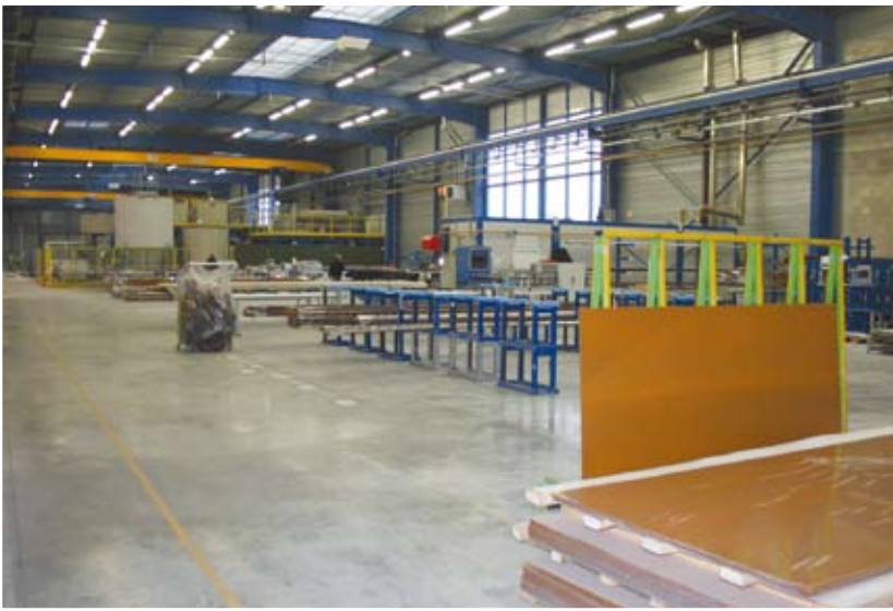
3 - L'area della lavorazione dei profili "effetto legno".