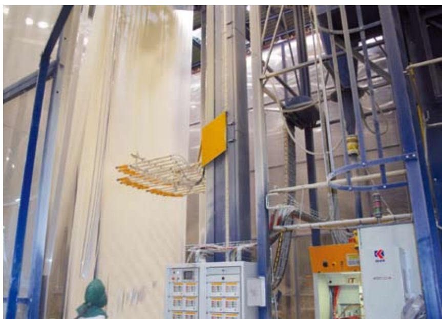
15 - Un dettaglio dell'applicazione: si osservino le 20 pistole sui due piani.

14 - Inside one of the two application booths.