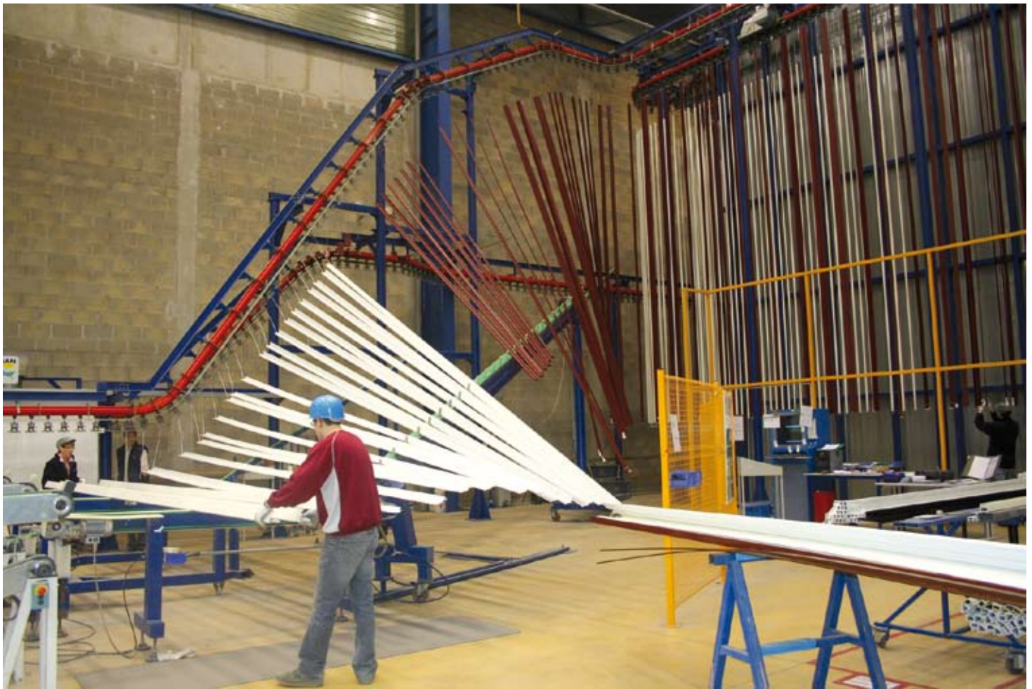
7 - L'uscita dei pezzi dall'impianto di verniciatura e relativo scarico.