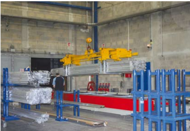
5 - La "bocca" di entrata al magazzino.