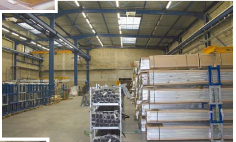
4 - L'area ricevimento materie prime. 4 - The area for receiving the raw materials.